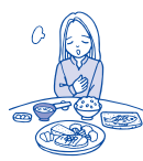
食欲不振 (食欲減退)